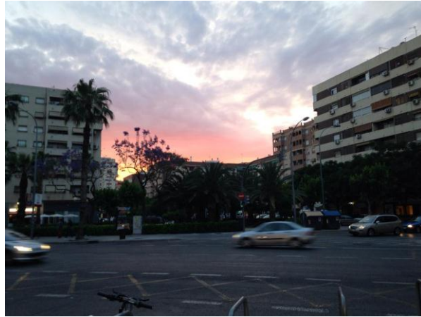
Nuestra primera impresión de Valencia a la llegada.