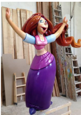
En el taller fallero

Las Fallas son unas fiestas que se celebran del 15 al 19 de marzo. Oficialmente empiezan el último domingo de febrero con el acto de la Crida. Actualmente, esta festividad se ha convertido en un atractivo turístico muy importante. Son días en que el humor, la imaginación y el espectáculo sonrían a los visitantes en una impresionante exhibición de arte y color. Un resultado perseguido con afán por artesanos, escultores, pintores y otros muchos profesionales que se encargan de crear las obras. Y también por las comisiones falleras que a lo largo de todo el año tratan de obtener ingresos para mantener viva la fiesta.