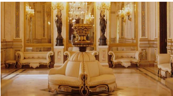
El salón de baile

La primera planta era un palacio barroco muy fastuoso. Había diferentes partes, que eran de varios siglos. Había un salón de baile, el famoso salón rojo y una la sala china. Algunos cuartos tenían mobiliario original y otros tenían mobiliario no valenciano, pero también antiguo. En la segunda planta había la cerámica. En esta planta había cerámica de todo el mundo, por ejemplo del mundo islámico, cristiano y chino.