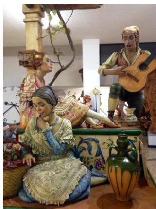
En el museo de las Fallas