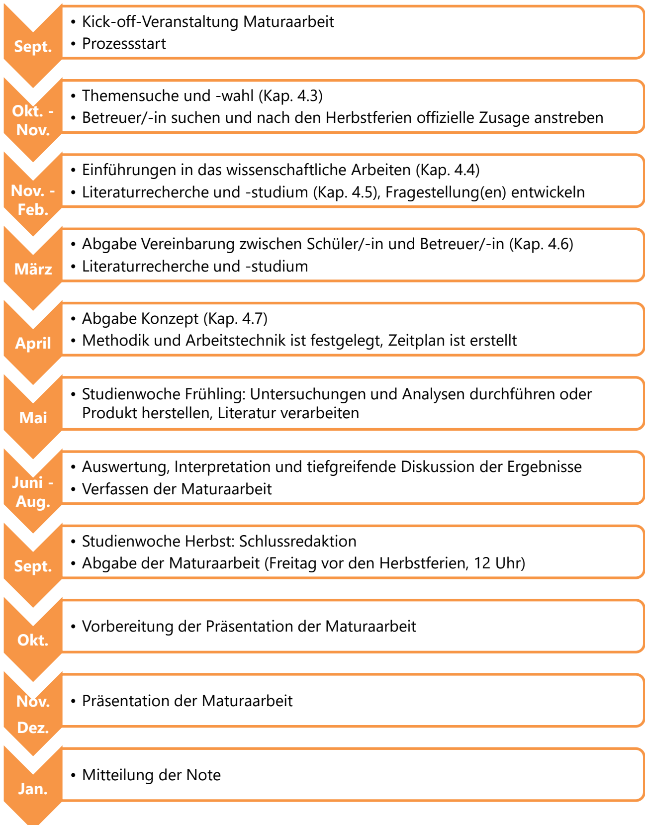
Abb. 1: Ablauf eines klassischen Maturaarbeitsprozesses in chronologischer Reihenfolge