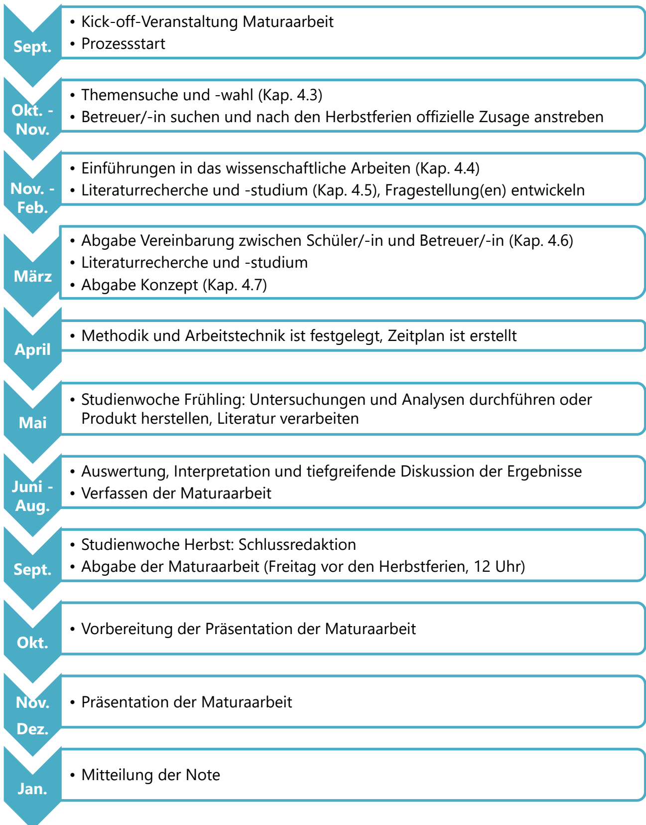
Abb. 1: Ablauf eines klassischen Maturaarbeitsprozesses in chronologischer Reihenfolge