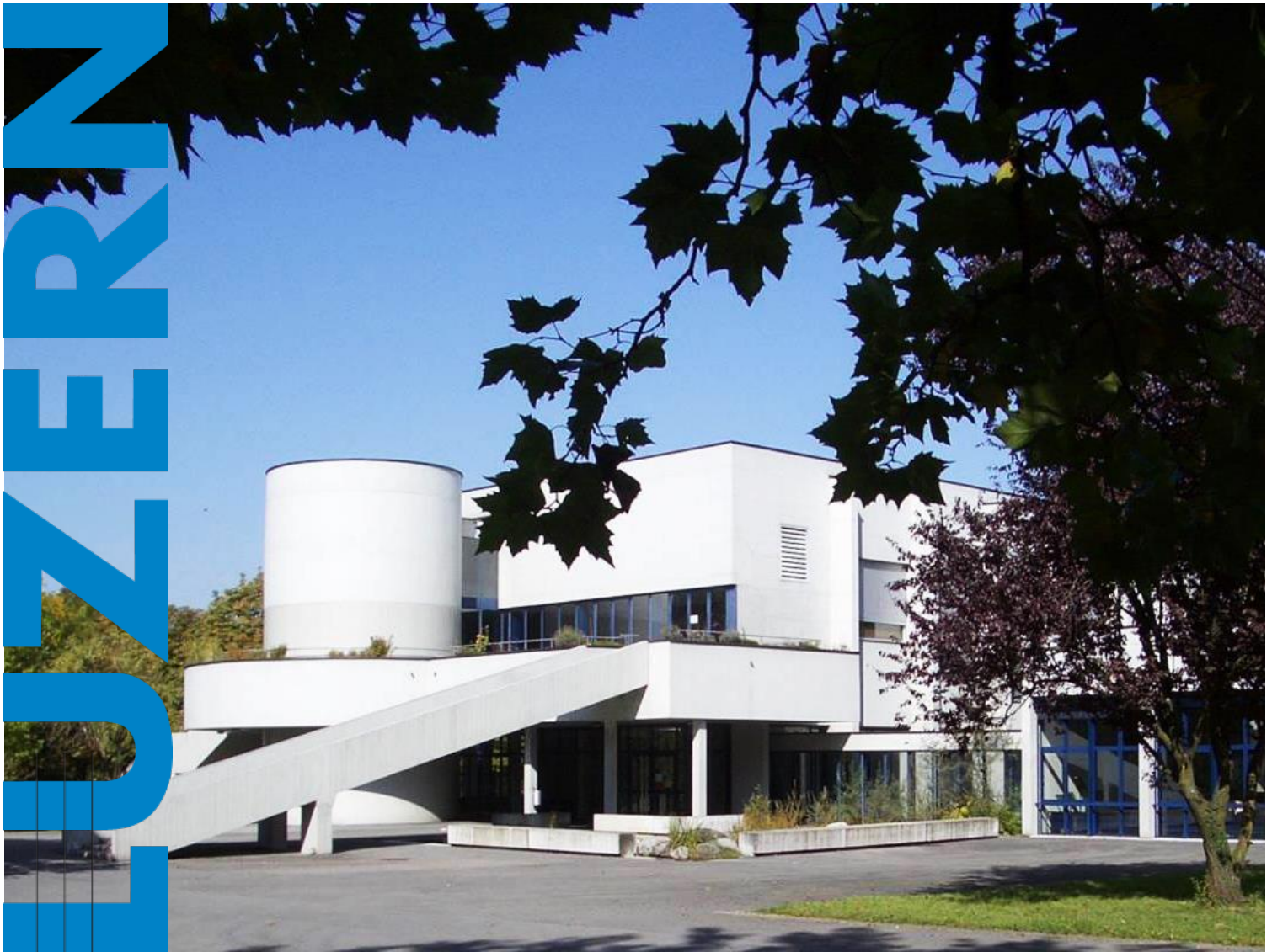
Aula der Kantonsschule Alpenquai Luzern